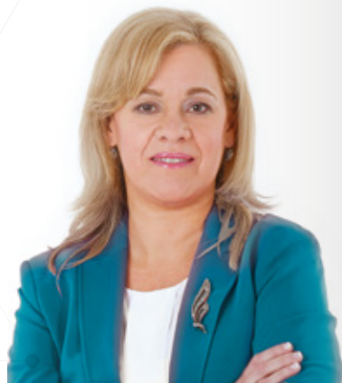
Presidente da Câmara Municipal da Amadora