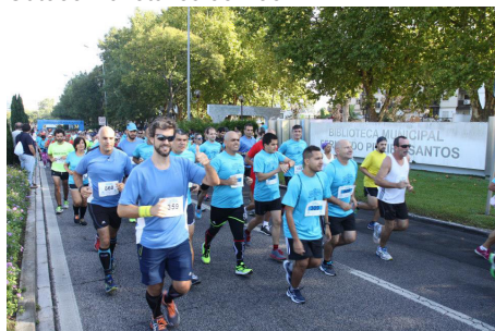
Participantes após o tiro de partida