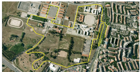
Percurso - Caminhada Solidária 5km