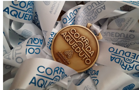
Medalha de participação