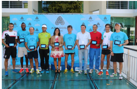
Homenagem aos melhores atletas nacionais