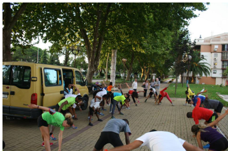
Treino de preparação para a Corrida do Aqueduto