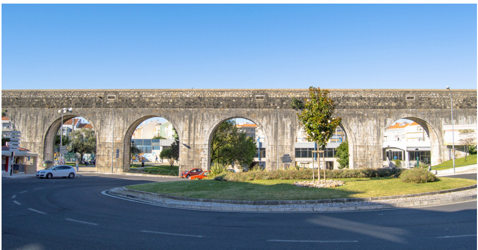
Aqueduto - Damaia (Concelho da Amadora)

(*) Texto adaptado da publicação "O Aqueduto das Águas Livres" do Núcleo Museográfico - Casal da Figueira