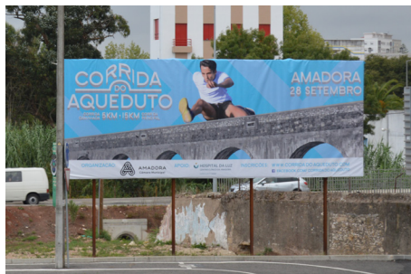
Outdoor na rotunda do Lido

Todos os atletas receberam uma tshirt técnica e medalha, podendo beneficiar no final de vários serviços disponibilizados desde massagens a check-up de saúde gratuito.