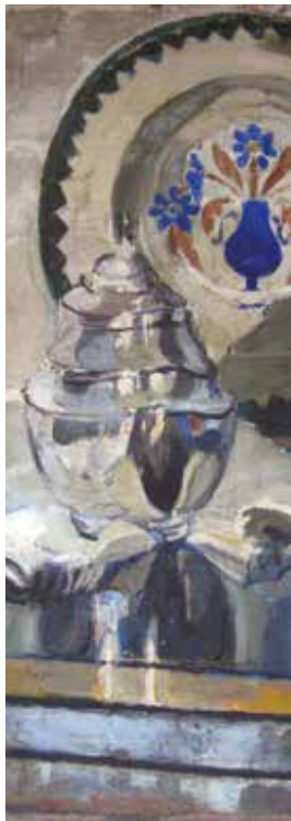
Mâmía Roque Gameiro - [O açucareiro], n. dat. Óleo s/ cartão, 40 x 36 cm. Col. particular.