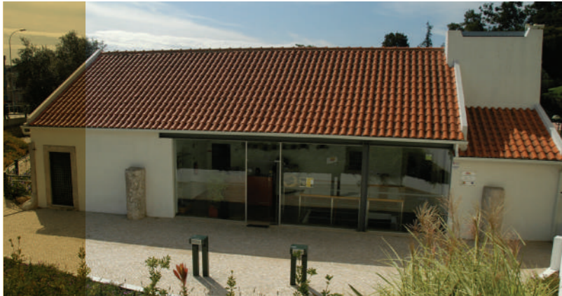
Núcleo Museológico do Casal da Falagueira de Cima.

Atualmente o Casal da Falagueira é a sede do Museu da Amadora, possuindo vários núcleos expositivos sobre Património Local. São realizados diversos eventos de educação patrimonial, como visitas orientadas ao Património Histórico e Arqueológico do Município, oficinas enquadradas no projeto "Museu em ação" e outras atividades no âmbito do projeto "Escola Aberta do Património".