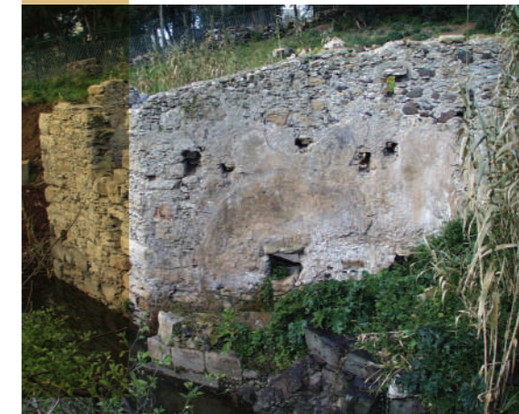
Azenha do Casal da Falagueira de Cima.

Junto da casa, construiu-se um açude, que acumulava a água, e que permitia a sua condução até à parte superior da roda vertical da moenda através de um canal, feito com lajes de pedra calcária: a levada. No seu interior foi encontrado um prato de faiança decorado com a cruz-espada da Ordem de Santiago produzido no século XVII.