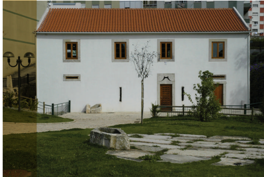
Núcleo Museológico do Casal da Falagueira de Cima.

Todo o casal pertenceu, em época indeterminada, à Ordem de Malta ou dos Cavaleiros Hospitalários, como comprovam os marcos de propriedade existentes, um deles identificado durante a escavação arqueológica de 1993, onde se conservam esculpidas as cruzes de oito pontas, símbolo da ordem religiosa.