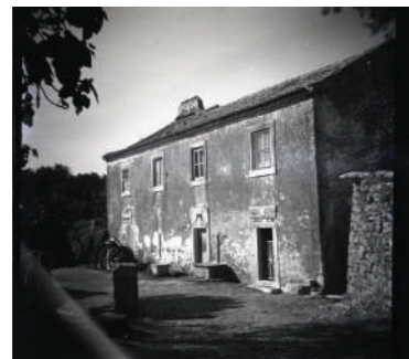
Casal da Falagueira de Cima (anos 60).

Todo o casal pertenceu, em época indeterminada, à Ordem de Malta ou dos Cavaleiros Hospitalários, como comprovam os marcos de propriedade existentes, um deles identificado durante a escavação arqueológica de 1993, onde se conservam esculpidas as cruzes de oito pontas, símbolo da ordem religiosa.