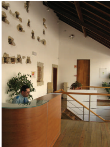
Orifícios do pombal.