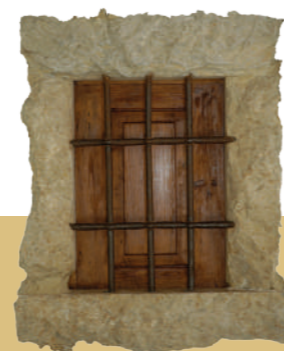
Pormenor de janela