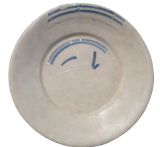
Prato de faiança. ©Museu da Amadora