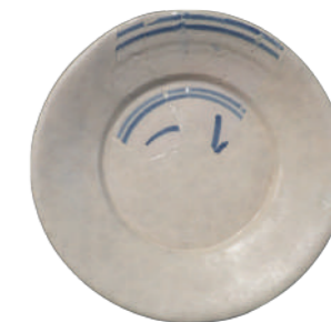
Assiette en faïence.