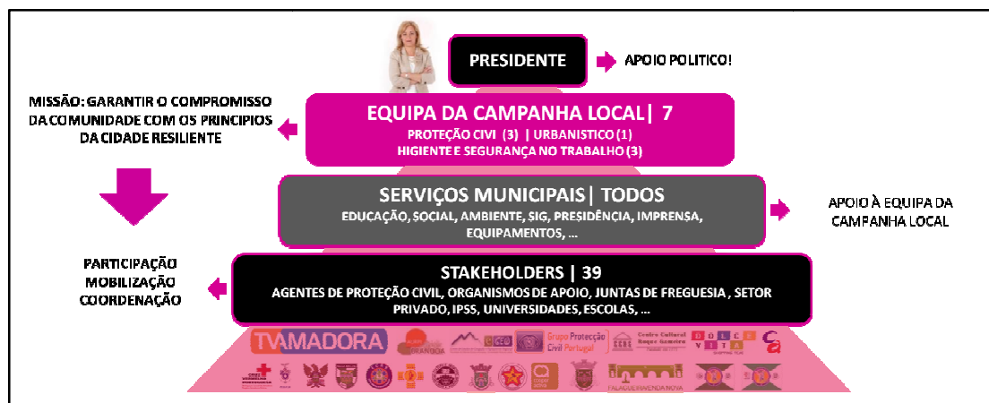
Figura 2- Estrutura da Campanha Local 2010-2015 “Sempre em Movimento, Amadora é Resiliente”

O segundo passo foi desenvolver mecanismos de sensibilização e formação para a população e stakeholders , de modo a ser possível transmitir-lhes os procedimentos corretos a dotar em situações de emergência. A equipa da Campanha Local, com o apoio dos parceiros tem concretizado diversas publicações 1 , planos de emergência (de acordo com os Cadernos Técnicos da Autoridade Nacional de Proteção Civil) e estudos técnico-científicos, em que se efetuou a análise dos riscos no município e as medidas estruturais e não estruturais a aplicar. A equipa desenvolveu ainda uma metodologia de trabalho 2 para a redução do risco de desastre nas infra-estruturas dos stakeholders , em que é prestado apoio técnico na identificação das inconformidades e na proposta de melhorias no âmbito do Regime Jurídico de Segurança Contra Incêndio em Edifícios (SCIE) e ministrada ações de formação e sensibilização aos utentes/utilizadores das instalações.