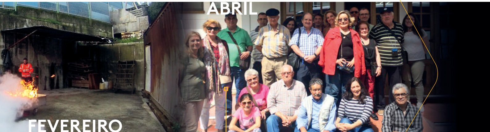
Visita de trabalho (Casa Tinoni)