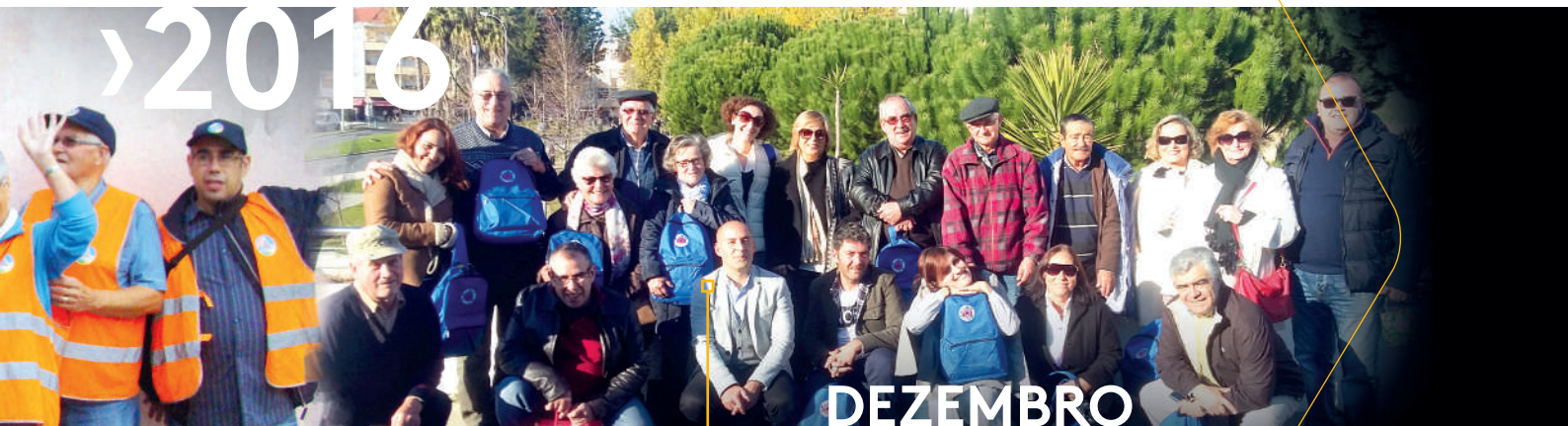
Almoço de Natal